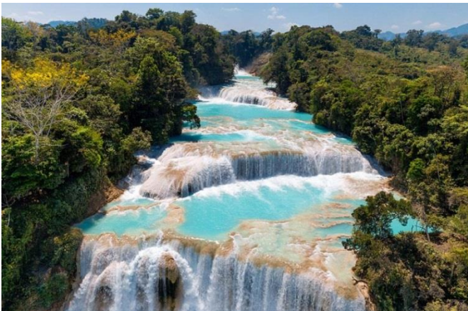
Cascades Agua Azul sur la rivière Yax-Ha Etat du Chiapa Mexique