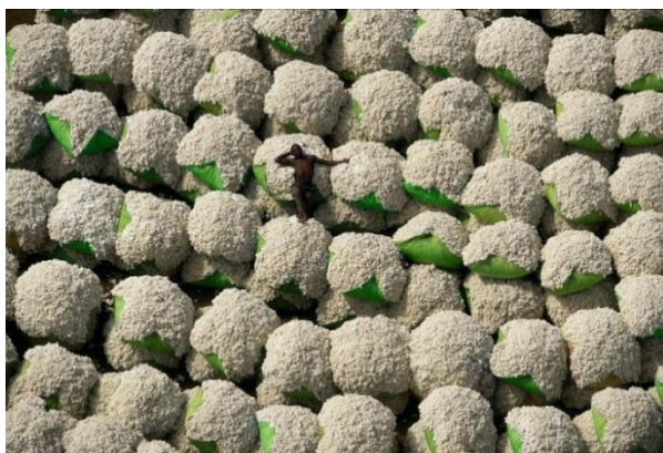
Balles de coton à Thonakaha Région de Korhogo Côte d'Ivoire