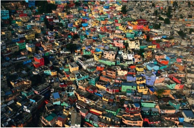
Bidonville de Jalousie à Pétion Banlieue de Port au Prince Haïti