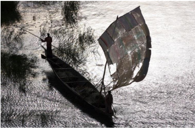
Barique sur le fleuve Niger Région de Tombonctou Mali