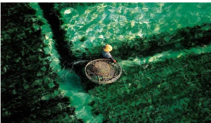
Récolte des algues Bali Indonésie