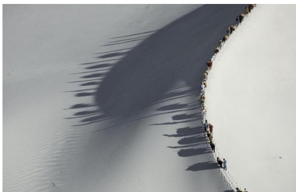
Caravane de yaks dans les dunes près de Skardu Vallée de l'Indus Pakistan