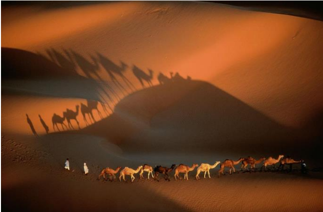
Caravane de dromadaires Nouakchott Mauritanie