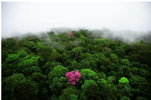
Ebène rose Montagne de Kaw Guyane française