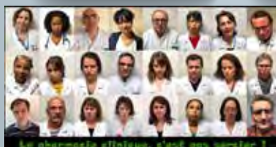
Le pharmacien clinicien, c'est pas un métier ?

https://www.youtube.com/watch?v=I-Q6iz0mc1w Prix du jury SFPC 2018