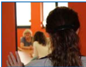
Réunions des familles