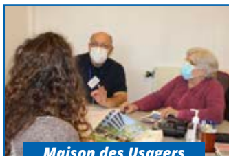
Maison des Usagers