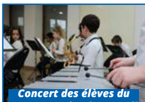
Concert des élèves du conservatoire de Draveil