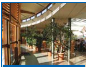
Hall d'accueil et cafétéria