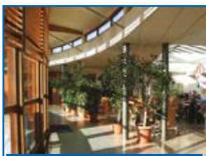
Hall d'accueil et cafétéria