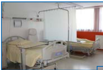
Un accueil dans des locaux entièrement rénovés, offrant des chambres spacieuses à un ou deux lits, avec salle d'eau...