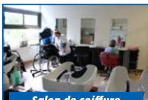
Salon de coiffure

... Des prestations de coiffure, pédicure, et, pour les patients en Soins de Longue durée, une équipe d'animation et une vêt'boutique.