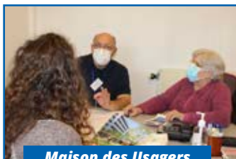
Maison des Usagers