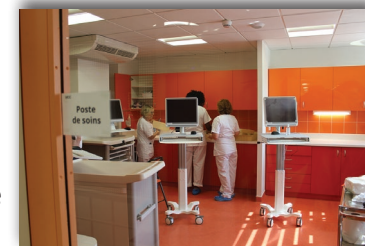
Poste de soins

Elles nécessitent un accord médical et administratif 48 heures avant la sortie effective.