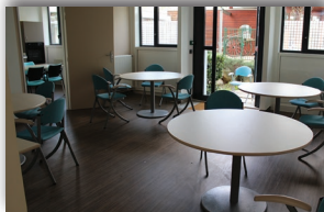
Salle à manger en UCC