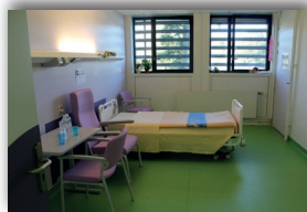
Une chambre en UHR