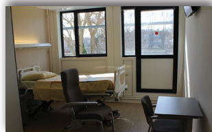
Une chambre en UCC

L'unité « Iris » occupe l'aile Nord du rez-de-chaussée. Elle correspond à l'UHR, proposant une prise en charge de soins de longue durée. Elle comporte 17 lits.