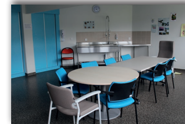
Salle de stimulation