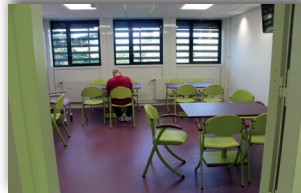
Salle à manger en UHR