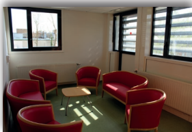
Salon des familles

Les deux unités communicantes sont sécurisées et adaptées aux troubles spécifiques des patients accueillis. Un contrôle des accès au niveau du hall central permet d'éviter le risque d'égarement des patients. Les déambulations sont facilitées ainsi que la possibilité de sortir dans des jardins clos.