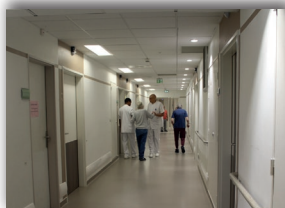
Circulation en UCC

Les deux unités communicantes sont sécurisées et adaptées aux troubles spécifiques des patients accueillis. Un contrôle des accès au niveau du hall central permet d'éviter le risque d'égarement des patients. Les déambulations sont facilitées ainsi que la possibilité de sortir dans des jardins clos.