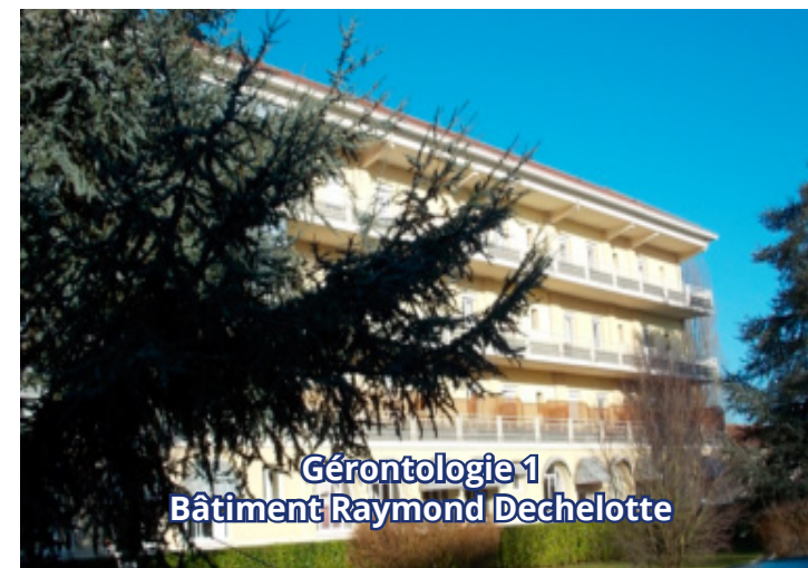
Gérontologie 1 Bâtiment Raymond Dechelotte

1 rue Georges Clemenceau 91750 CHAMPCUEIL 01 69 23 20 20