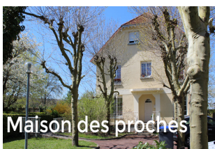
Maison des proches