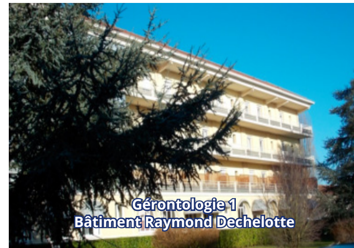
Gérontologie 1 Bâtiment Raymond Dechelotte

1 rue Georges Clemenceau 91750 CHAMPCUEIL 01 69 23 20 20