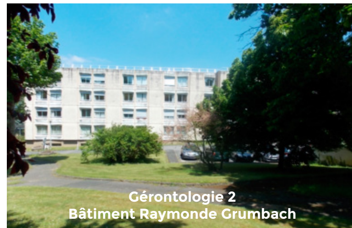
Gerontologie 2 Bâtiment Raymonde Grumbach

1 rue Georges Clemenceau 91750 CHAMPCUEIL 01 69 23 20 20